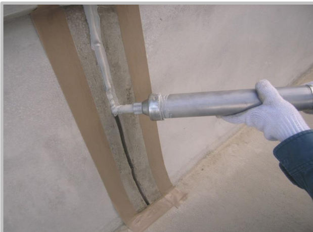
③ プライマー塗布工(1次) ④ シーリング材充填工