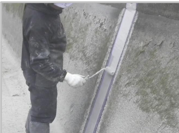
⑦ トップコート塗布工