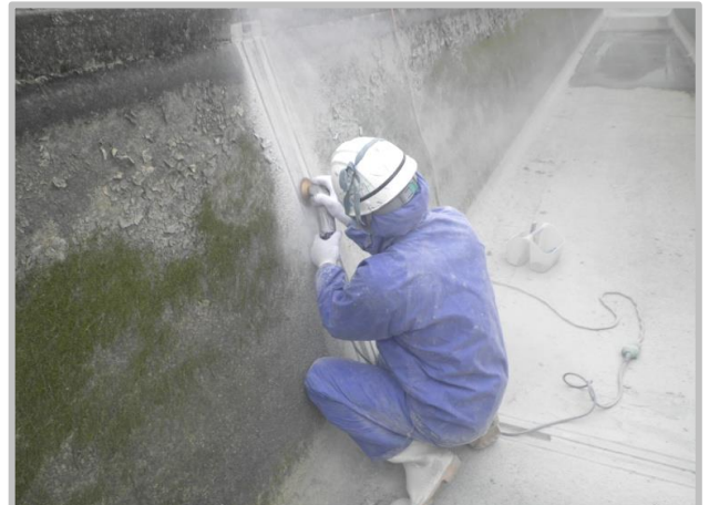
① U字溝成形工 ② 切削工