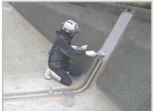
⑤ プライマー塗布工(2次) ⑥ ポリウレタ樹脂塗布工