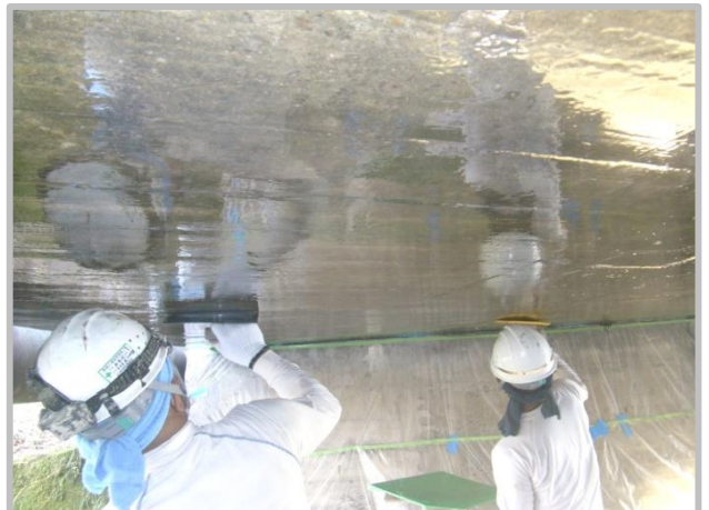
④ 表面被覆工(床版下面)