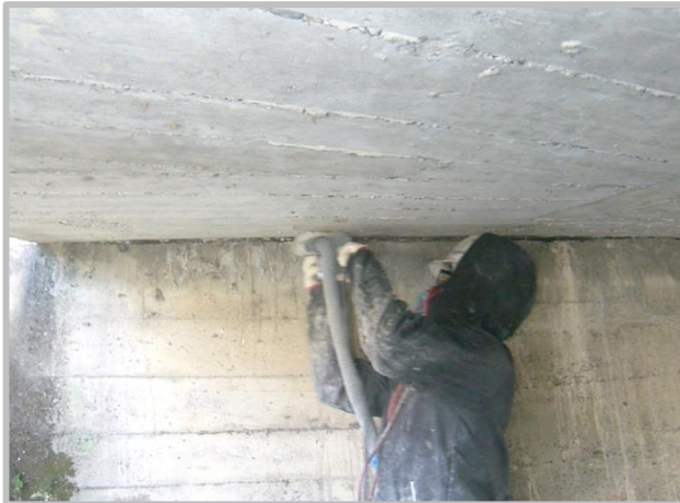
① 下地処理工(ケレン工)