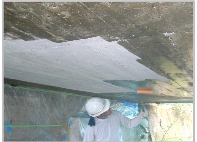
② プライマー塗布工